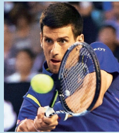
NOVAK DJOKOVIC, 28, TENNISSTAR, achtet auf seine innere Uhr. So trinkt er nach dem Erwachen warmes Wasser – als Unterstützung für den Darm, der sich laut Alternativmedizin am Morgen regeneriert