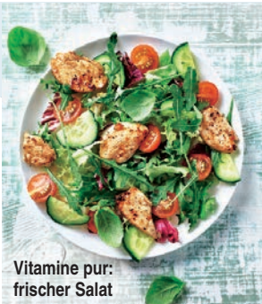
Vitamine pur: frischer Salat

► Als Ergänzung können auch Nahrungsergänzungsmittel helfen. Wichtiger Inhaltsstoff ist das Energievitamin B12 (z. B. in „Doppelherz System Vitamin B12 plus“-Trinkfläschchen, „Doppelherz aktiv Vitamin B12“-Tabletten). Ebenfalls wichtig: Mineralien wie Magnesium und Kalzium (u. a. in „Orthomol vital f“-Tabletten).