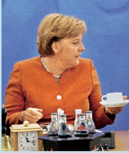
ANGELA MERKEL, 61, KANZLERIN, über ihren Tagesrhythmus: „Ich bin wohl eher ein Morgenmuffel. Die Leistungsfähigkeit nimmt über den Tag zu“

Glücklicherweise erfordern Diäten nach der Bio-Uhr kein kompliziertes Timing. Im Gegenteil, ihr oberstes Abnehmgebot ist simpel. Internist Detlef Pape: „Abends sollte der Körper nicht mehr mit Kohlehydraten aus