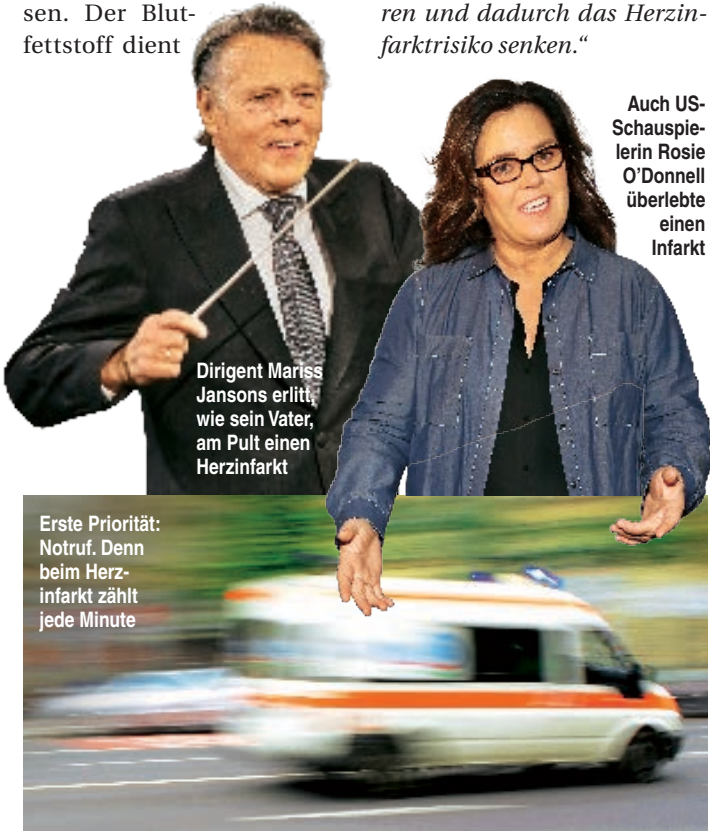
Auch US-Schauspielerin Rosie O'Donnell überlebte einen Infarkt

Die Studie zeigt, dass nicht nur Ernährung und Veranlagung die Konzentration von Triglyzeriden im Blut beeinflussen, sondern auch das Gen ANGPTL4: Es bremst ein Enzym, das den Triglyzerid-Abbau im Blut bewirkt. „Anhand unserer Ergebnisse gilt es jetzt, Medikamente zu entwickeln, die die Wirkung des ANGPTL4-Gens neutralisieren und dadurch das Herzinfarktrisiko senken.“