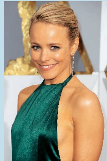
RACHEL McADAMS, 37, SCHAUSPIELERIN („Midnight in Paris“), lebt streng nach ihrem Chronorhythmus. „Ich stehe jeden Morgen um halb fünf Uhr auf, ohne Wecker.“ Abends geht sie bereits um neun Uhr ins Bett. „Licht aus, ganz rigoros. Schlaf ist Teil meiner Routine“

Reis, Brot, Nudeln oder Süßem gefüttert werden.“ Diese Kost mobilisiert sonst das Insulin, das von der Bauchspeicheldrüse produziert wird. Dieses Dickmacherhormon steuert die Fettspeicherung. Liegt der Insulinspiegel hoch, lagert der Körper die Kalorien eher im Fettgewebe ein, als dass er sie verbrennt.