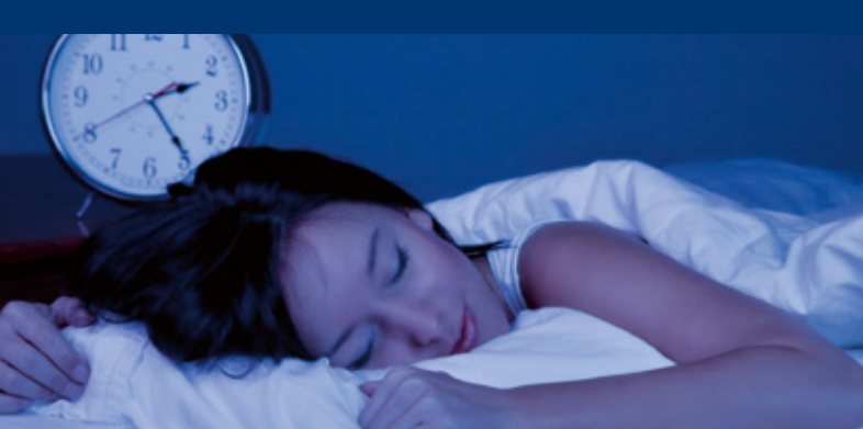
Endlich wieder erholsam schlafen...